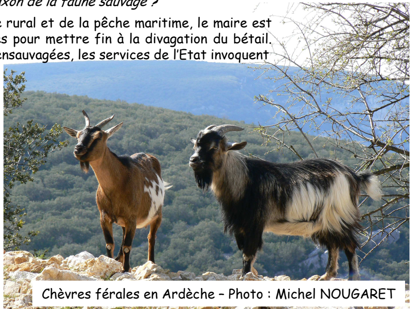
Chèvres férales en Ardèche - Photo : Michel NOUGARET

Le troupeau de chèvres férales, de la race commune de l'Ouest (dite "Chèvre des Fossés"), des falaises de Jobourg