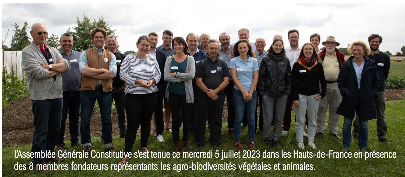
L'Assemblée Générale Constitutive s'est tenue ce mercredi 5 juillet 2023 dans les Hauts-de-France en présence des 8 membres fondateurs représentant les agro-biodiversités végétales et animales.

Une fédération nationale est née avec un objectif : agir pour sauvegarder et valoriser nos biodiversités domestiques et cultivées de toutes nos régions de France !